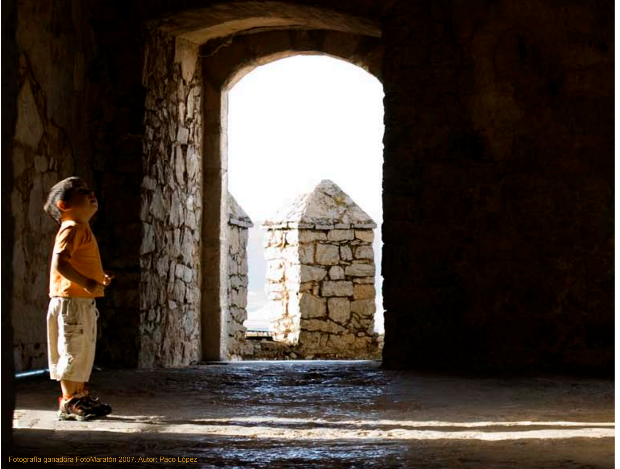
Fotografía ganadora FotoMaratón 2007. Autor: Paco López